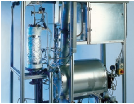
Teststand für die autotherme Reformierung von Diesel für den Einsatz auf Schiffen.