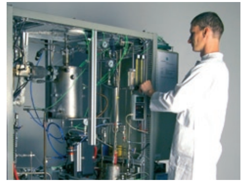
Vollautomatisierte Anlage zur autothermen Reformierung von entschwefeltem Kerosin Jet A-1 zur Versorgung einer SOFC.